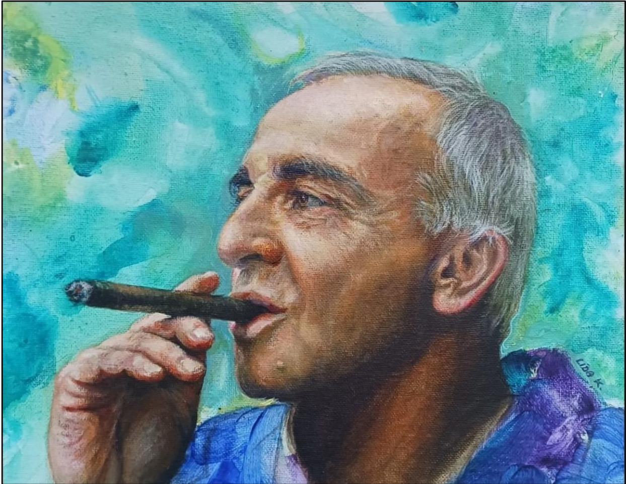
Táta, akryl na plátně, 2014. (30 x 25 cm)