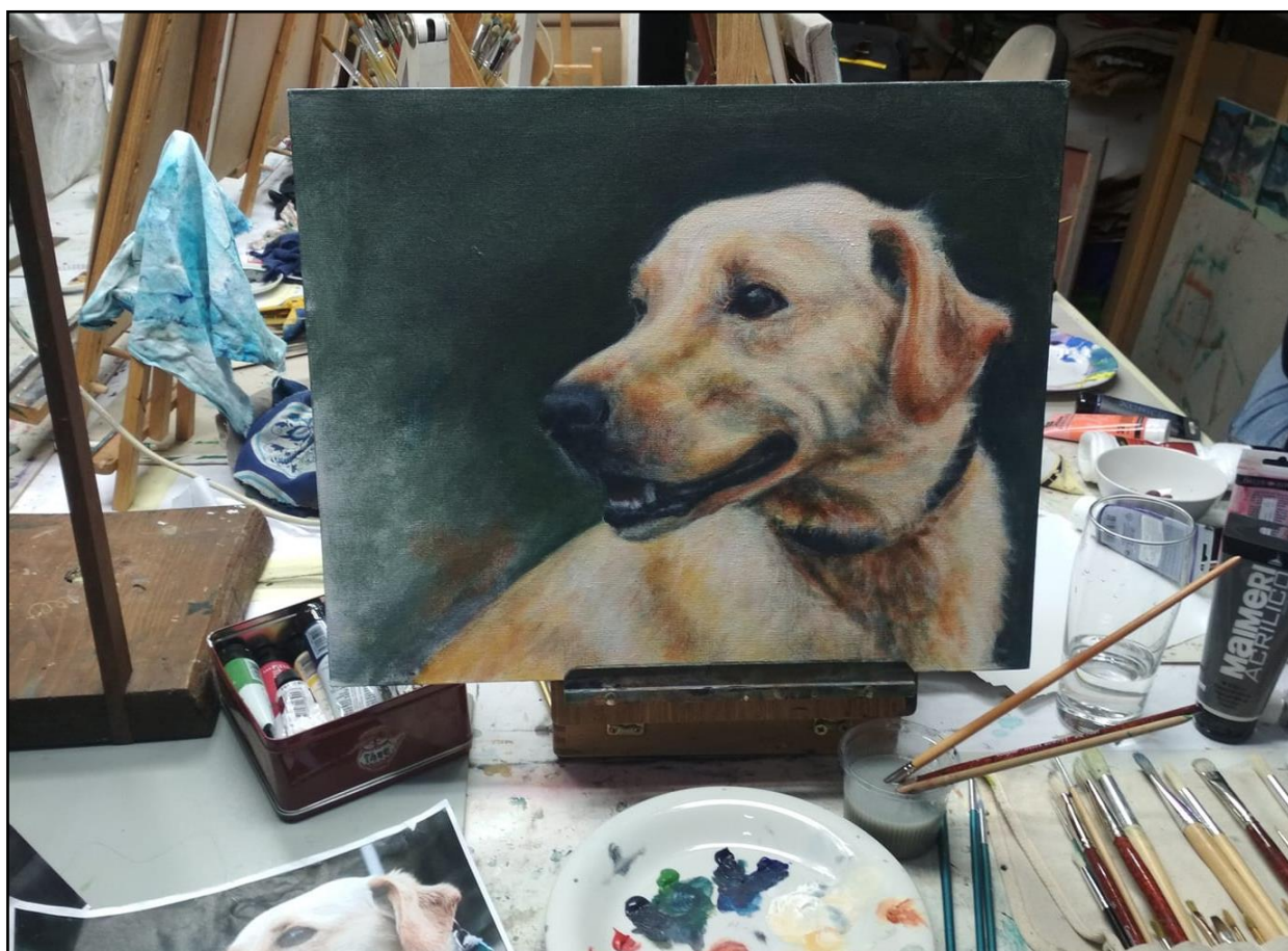
Pedro, 2020, akryl na plátně. (40 x 50 cm) – v procesu malby

V současné době se jednou týdně scházím se skupinou amatérských malířů z ČB v pronajatém ateliéru, kde společně malujeme, debatujeme o umění, občas navštívíme výstavu či vernisáž nebo jen tak zajdeme na sklenku dobrého vína. Každý rok také společně vyrážíme na námi organizovaný prodloužený umělecký víkend – na plenér na Šumavu.